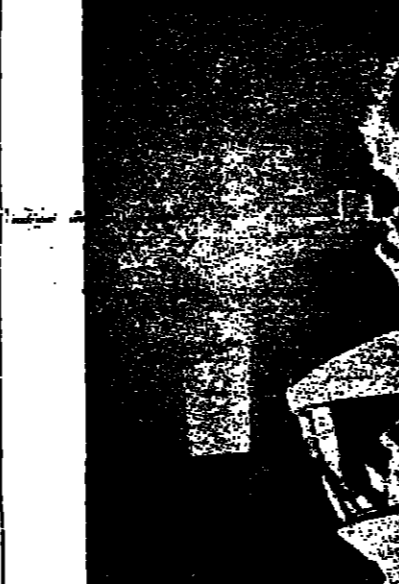
لقطة أثناء عمل ساتلتي كوبريك في « اوديسا الفضاء » .

القوية بل وتكون كوبريك في « اوديسا الفضاء » القليلة في يتر الكوكب القاطن وفي مشهد ربما يكون من اجود المشاهد الخيرية التي شهدتها السينما .